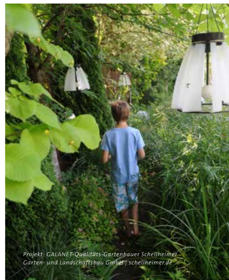
Projekt: GALANET-Qualitäts-Gartenbauer Schellheimer Garten- und Landschaftsbau GmbH | schellheimer.de