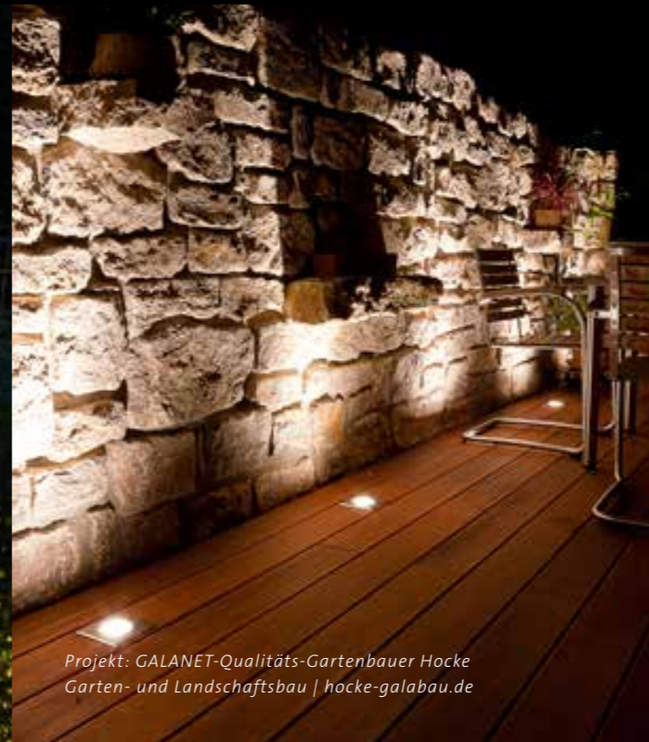
Projekt: GALANET-Qualitäts-Gartenbauer Hocke Garten- und Landschaftsbau | hocke-galabau.de