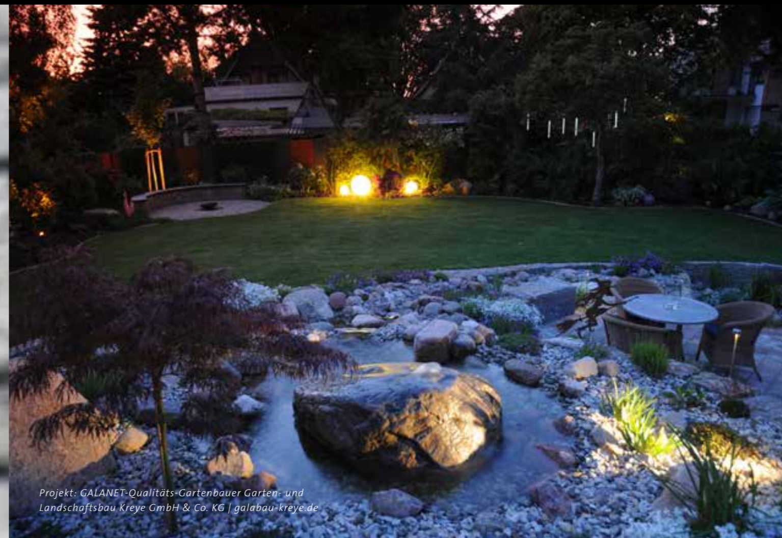
Projekt: GALANET-Qualitäts-Gartenbauer Garten- und Landschaftsbau Kreye GmbH & Co. KG | galabau-kreye.de

Adieu Sommer! Hallo Herbst! Wenn sich die Natur wieder in Schale wirft und ihre neue Kollektion in den Nuancen Orange, Rot und Gold auf dem Laufsteg der Jahreszeiten zur Schau trägt, beginnt auch für Ihren Garten eine neue Saison. Tagsüber lässt die Herbstsonne die Farben leuchten, abends benötigt sie Unterstützung in Sachen Strahlkraft.