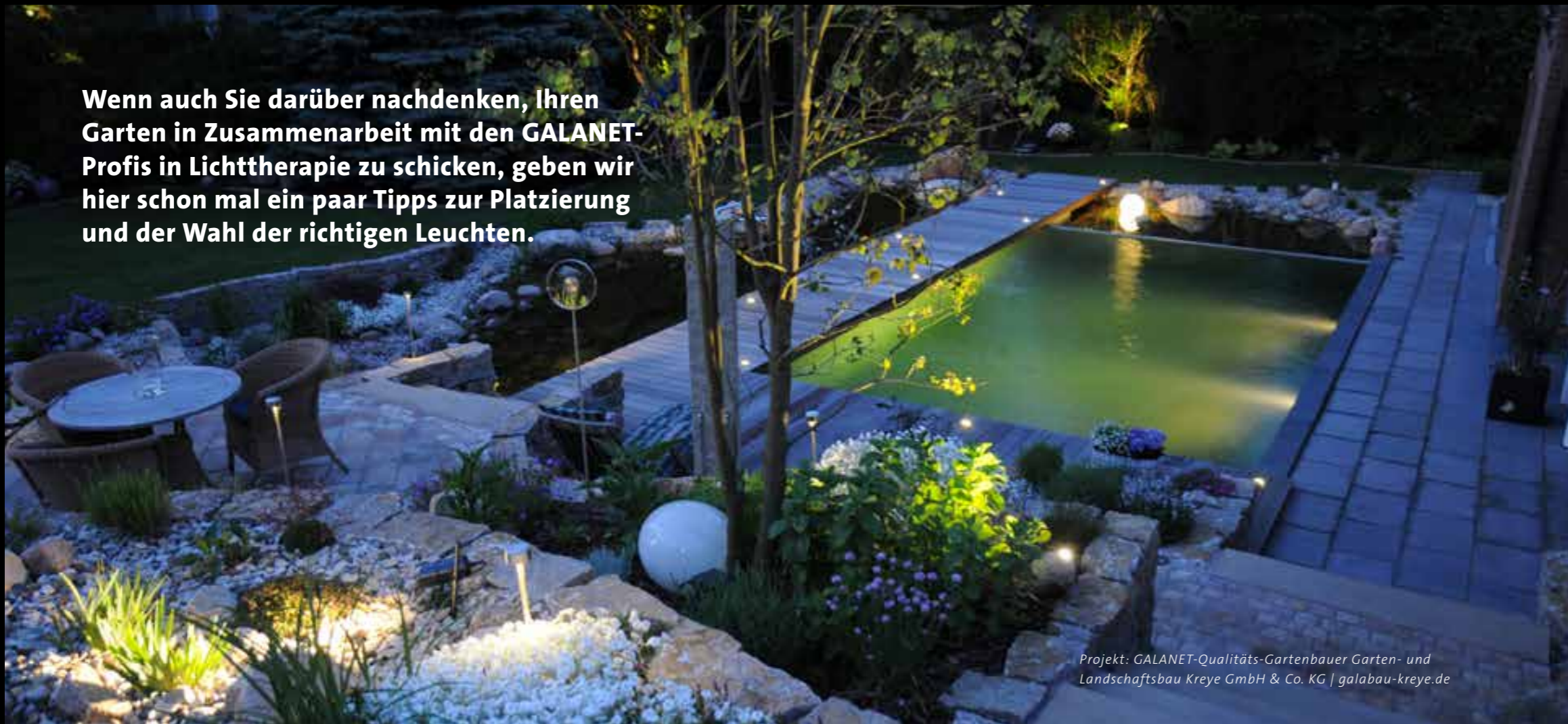
Projekt: GALANET-Qualitäts-Gartenbauer Garten- und Landschaftsbau Kreye GmbH & Co. KG | galabau-kreye.de

Wenn auch Sie darüber nachdenken, Ihren Garten in Zusammenarbeit mit den GALANET-Profis in Lichttherapie zu schicken, geben wir hier schon mal ein paar Tipps zur Platzierung und der Wahl der richtigen Leuchten.