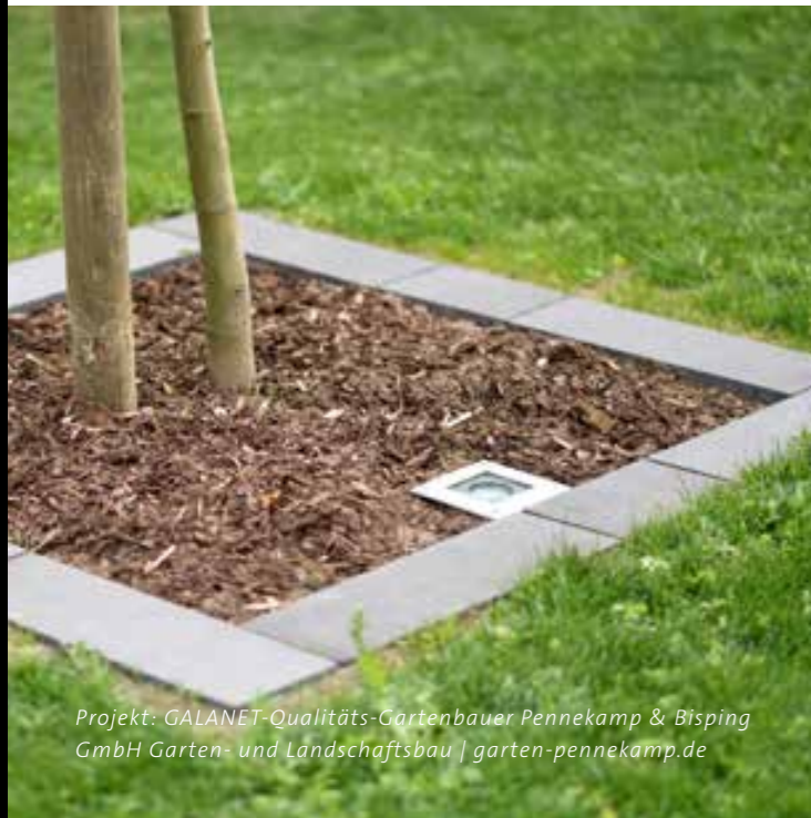
Projekt: GALANET-Qualitäts-Gartenbauer Pennekamp & Bisping GmbH Garten- und Landschaftsbau | garten-pennekamp.de

Das Set ist Ihr Garten, Pflanzen und Skulpturen haben die Hauptrolle übernommen. Um einzelne Elemente Ihres Außenbereiches filmreif in Szene zu setzen, eignen sich Spots am besten. In Bodennähe installiert, bringen Sie Kunstobjekte, elegant gewachsene Baumstämme und voluminöse Büsche im Dunkeln groß raus.