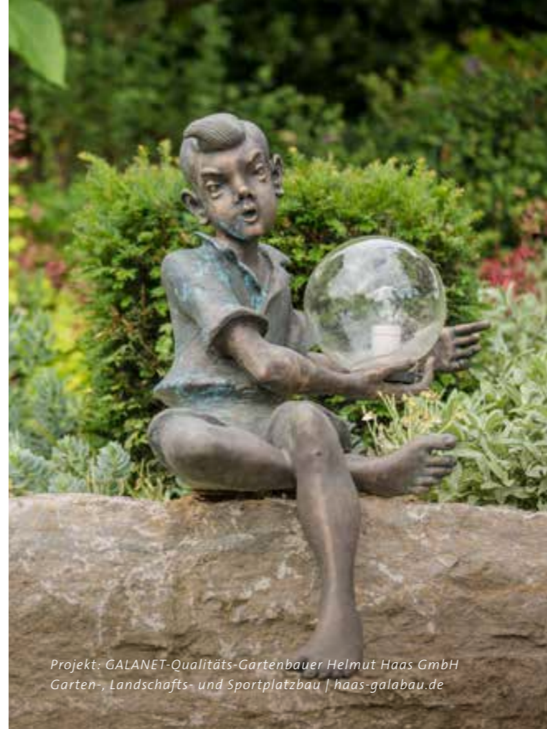
Projekt: GALANET-Qualitäts-Gartenbauer Helmut Haas GmbH Garten-, Landschafts- und Sportplatzbau | haas-galabau.de

Um Ihren Garten auch nach Einbruch der Dunkelheit weiter strahlen zu lassen, muss nicht die gesamte Fläche beleuchtet werden. Perfekt geplant und fachmännisch umgesetzt, tanzen Licht und Schatten leichtfüßig über Grünflächen, Blumenbeete, Terrassen und Wasseroberflächen.